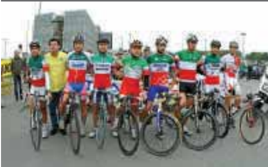
Gli 8 campioni italiani al via